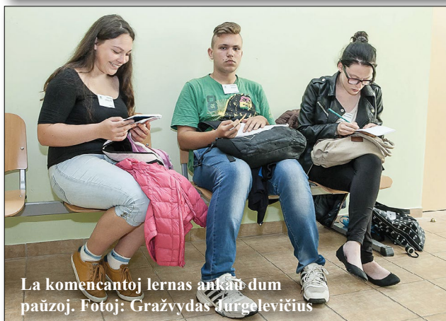
La komencantoj lernas ankaŭ dum paŭzoj.