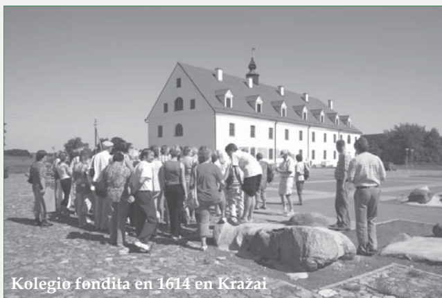
Kolegio fondita en 1614 en Kražai