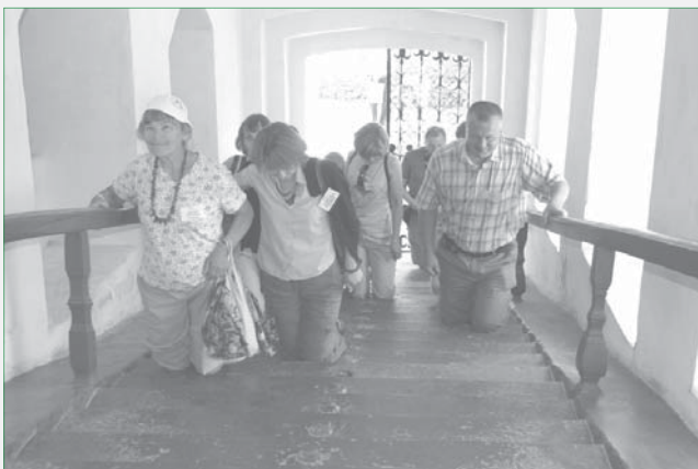
Surgenue ni iris sur 30 ŝtupojn, ĉar tie muntita estas la sankta relikvo el Jerusalemo.