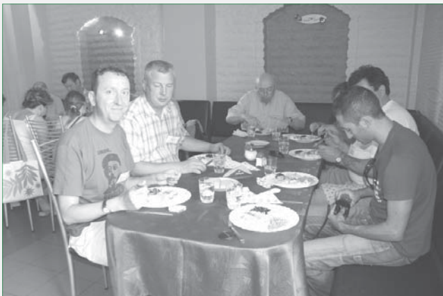
Ekscursis ne nur ni, sed ankaŭ beto, karoto, terpomo kaj porkaĵo ekscursis en nia stomako.