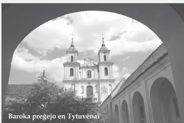
Baroka preĝejo en Tytuvėnai