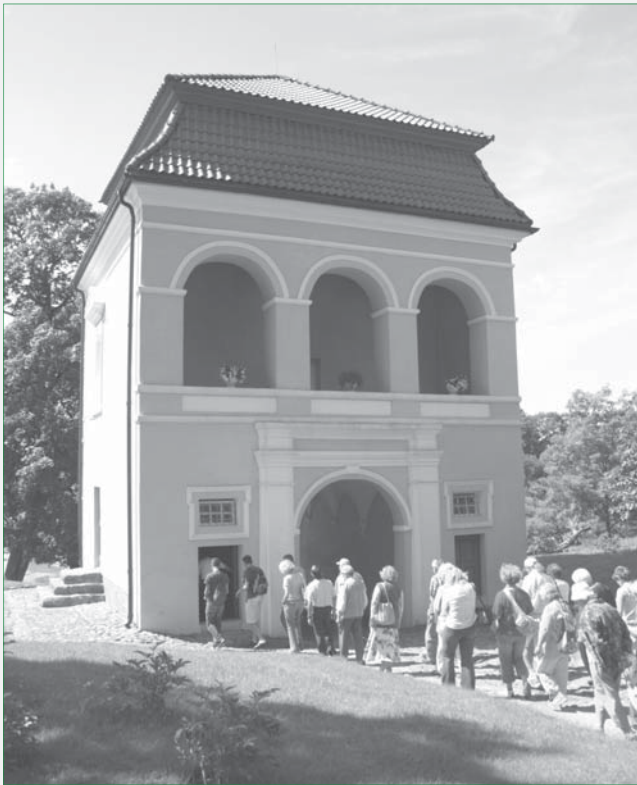
La pordo kun tri funkcioj: biblioteko, prizono kaj trapasejo