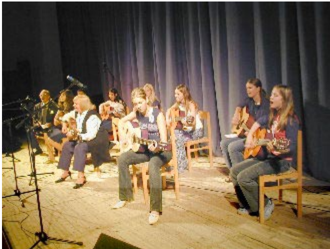
▲ Latva vespero kun bonestosa gitarkantado.