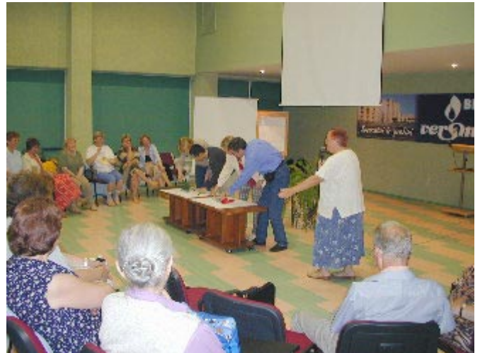
▲ Konkurso-kvizo pri la historio de la Esperanto-movado.