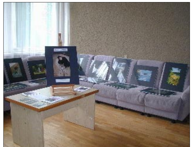
▲ Ekspozicio de Andrzej Sochacki pri “E-aranĝoj”.