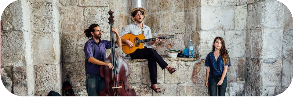
Strat-muzikistoj en Jerusalemo, Israelo - eĉ sekulare eblas esti judo

K iam mi mencias la fakton, ke mi estas judo, foje iu komentas kun surprizo: “Sed ĉu vi ne estas ateisto?” Aŭ inverse. Tia demando baziĝas en la kristana vidpunkto, ke religio estas filozofio, kredo, vivmaniero, tute sen rilato al specifa popolo.