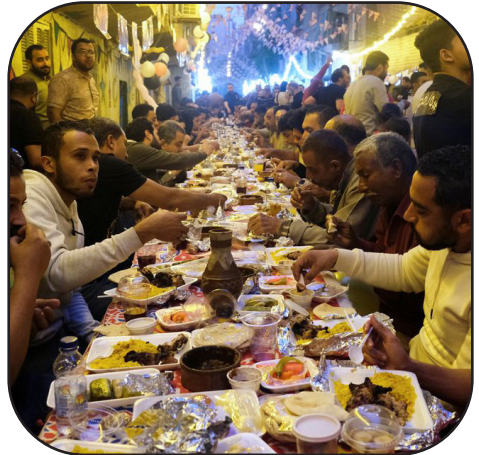
Kairo - dum Ramadanano oni ĉiutage fastas kaj poste festas

Artikolo preparita de la redakcio de Ateismo surbaze de informoj en la ĉi-supre menciita gazeto.