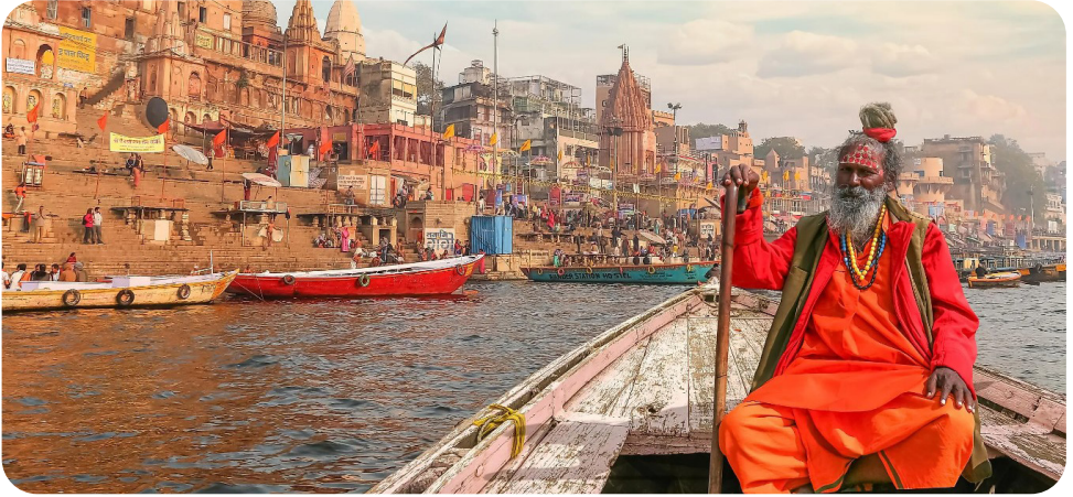
Urbo Varanasi sankta por hinduoj - kredantaro kaj komunumo

M i ĉiam insistas, ke religio ne estas gena afero, sed ideologio aŭ kredaro. Tamen tutmonde infanoj efektive heredas la religion de siaj gepatroj. Jam antaŭ ol kompreni la enhavon de sia religio, infanoj estas kristanoj aŭ islamanoj aŭ hinduoj aŭ judoj aŭ budhanoj aŭ ano de iu alia religio – kaj ankaŭ specifa tipo de kristano, islamano ktp (ekz. katoliko, luterano; sunaisto, ŝijaisto). Feliĉe, ambaŭ miaj gepatroj estis agnostikuloj kaj ne edukis min kredi je iu ajn religio. Ĉiuokaze la fakto, ke ili venis de du apartaj religiaj tradicioj (hindua, kristana) certe malfaciligis ian endoktrinigon.