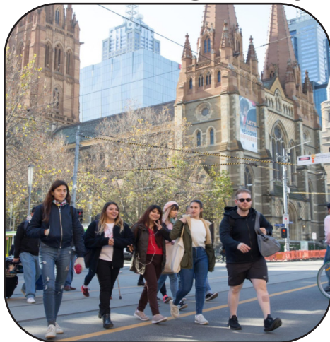
Aŭstralia urbo Melburno - junuloj paŝas en ĉiam pli sekularan estontecon

Interesa kaj kuraĝiga fakto estas, ke preskaŭ ĉiuj komentoj de legantoj sub la artikolo esprimas ĝojon pro la evoluo direkte al ne-religiemo. Kelkaj komentas, ke eble la nombroj ne vere tiel multe ŝanĝiĝis, sed ke pli verŝajne, la homoj nuntempe estas pli pretaj identigi sin kiel "nekredantojn", dum en pasintaj popolnombradoj ili