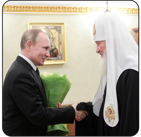
Vladimir Putin kaj Patriarko Cirilo - aliancanoj en agresado

Kelkajn tagojn antaŭ lanĉi sian invadon, Putin deklaris, ke rusoj kaj ukrainoj estas la sama popolo, kion ankaŭ Cirilo proklamis post kiam komenciĝis la invado. Krome, la matenon de la invado, Putin anoncis, ke lia “speciala operacio”