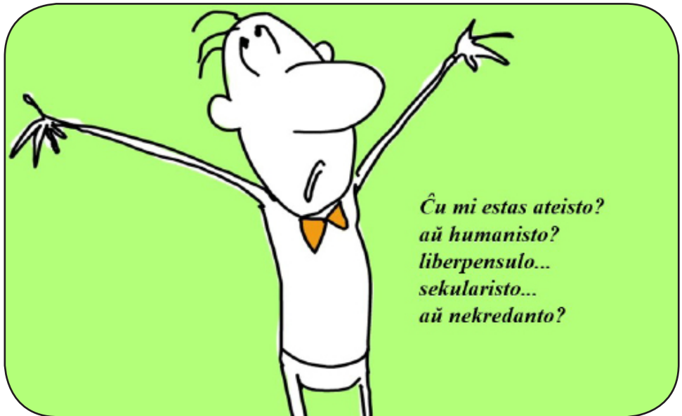
Bildo el la prezentaĵo pri ATEO

Teksto preparita de la redakcio de Ateismo.