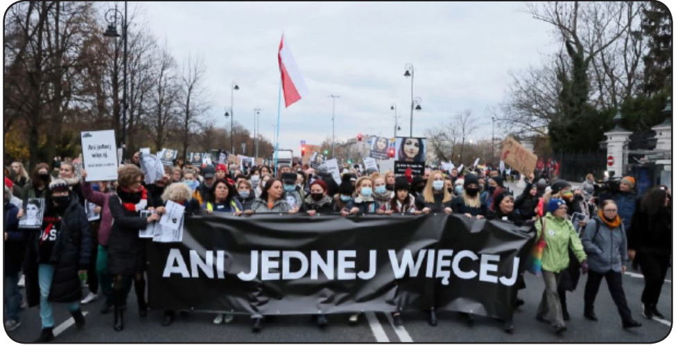
“Eĉ ne unu pli”

E n januaro ĉi-jare efektiviĝis juĝo de la Konstitucia Tribunalo de Pollando, kiu deklaris, ke abortigoj de difektitaj fetoj estas kontraŭ-konstituciaj. La juĝo igis pli rigora la jam severan abortigo-leĝon, laŭ kiu abortigo estis permesebla nur se 1) la gravediĝo rezultis de seksperforto, 2) la graveda virino estas en vivdanĝero, aŭ 3) la fetto estas difektita. Do, la Tribunalo forigis tiun trian permeseblan kialon por abortigo. Tion ĝi faris responde al peto de 119 membroj de la parlamento el la ĉefa reganta partio, Juro kaj Justeco (pola mallongigo “PiS”), kaj du aliaj dekstraj partioj. PiS estis premata de la Katolika Eklezio plene akordigi la