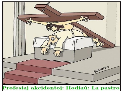
Profesiaj akcidentoj: Hodiaŭ: La pastro

Traduko fare de la redakcio de partoj de anglalingva artikolo de Alain Gabon aperinta en la retejo Politics Today ( https://politicstoday.org/france-report-on-sex-crimes-by-catholic-church/ )