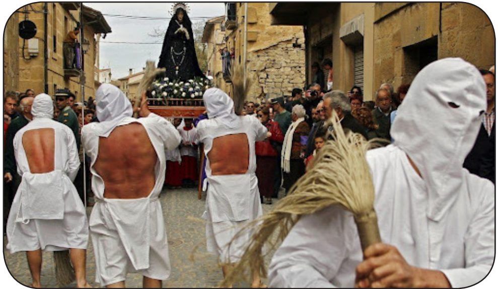
Pilgrimado de katolikaj flagelantoj | Hispanio 2018

Kompreneble se dio ne ekzistas, oni ne bezonas religion. Sed tio estas ateisma konkludo, kiun oni ne rajtas trudi al kredantoj. Eĉ pro tio, ke ĝi estus kontraŭ la Universala Deklaracio de Homaj Rajtoj.