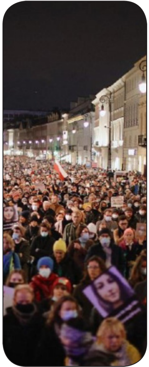
Protesto post la morto de Iza

Artikolo verkita surbaze de raportoj de BBC, Reuters, DW, Onet.pl, ABC.net.au kaj aliaj fontoj.