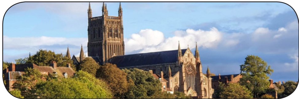
La katedralo de Worcester, Anglio

L iberalaj teologoj dediĉas sin al la tasko fari kristanisman akceptebla al la kritika menso. Per “senmitigado” kaj “biblia ekzegezo” [kritika interpretado – Red.], ili provas ĝisdatigi tradiciajn doktrinojn de la fido, tiel forigante konfliktojn inter racio kaj fido. La liberalo pretendas doni al ni ekvidon de la “vera” signifo de la biblia rakontado – sed tio ne tro similas al la kristanismo konata de dudek jarcentoj.