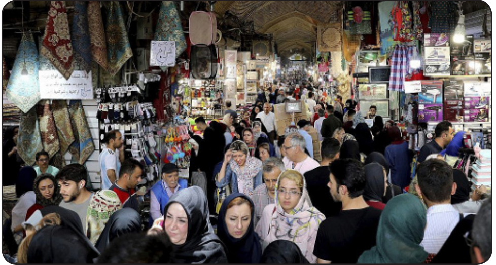
Bazaro en Tehrano

E ĉ pli miriga ol la rezultoj de la enketo farita en arabaj landoj, pri kiu temis la antaŭa artikolo, estas la rezultoj de enketo pri Irano farita de la nederlanda organizaĵo GAMAAN (Group for Analyzing and Measuring Attitudes in Iran – Grupo por la Analizado kaj Mezurado de Sintenoj en Irano). Laŭ la enketo, 47% da irananoj estas ŝanĝintaj sian mondrigardon de religia al nereligia. Tio estas eble la plej frapa el multaj frapaj eltrovoj de la enketo, kiujn ni resumos ĉi tie.