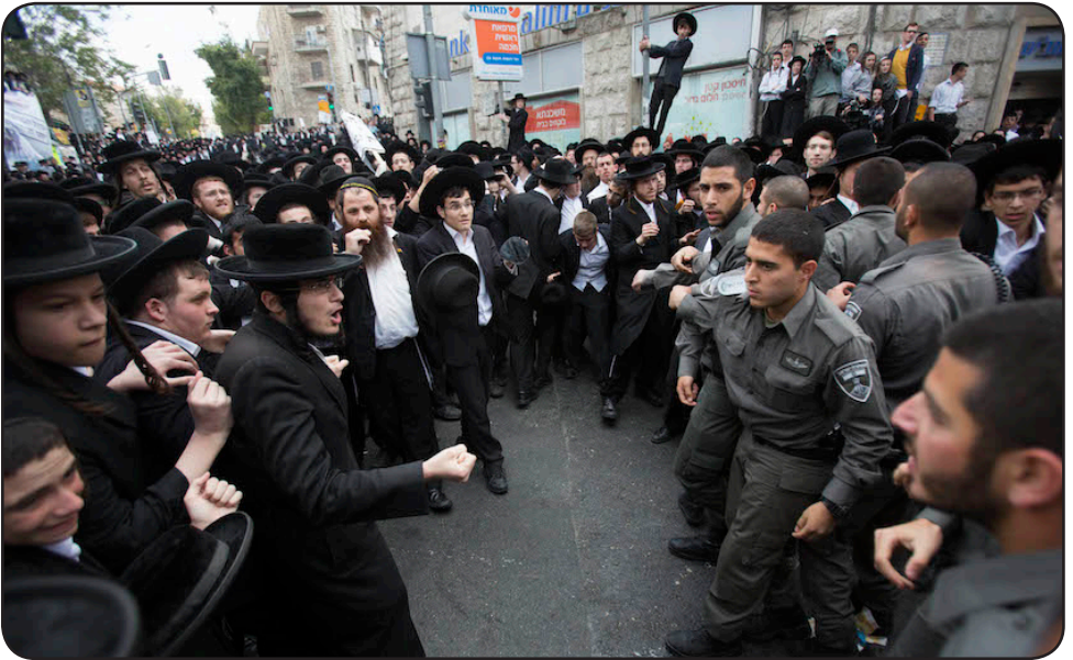
Ultra-ortodoksuloj protestas en Jerusalemo

E n la hodiaŭa Israelo okazas pli kaj pli akra konflikto inter modernaj sekularaj tendencoj kaj religiaj streboj. Politikaj partioj estas bazitaj sur mondkonceptoj, sed krome la religiaj partioj ofte estas organizitaj laŭ devenoj. Pri tiu kultura-religia-politika batalo aperis la ĉi-suba artikolo en iu israela gazeto. Jam ne freŝa – sed ĉiam aktuala. En la konflikto inter sekularuloj (ĉefe aŝkenazoj, sed ankaŭ kleraj homoj alidevenaj) kaj kredantoj, ĝi vidas kolizion inter Okcidento kaj Oriento.