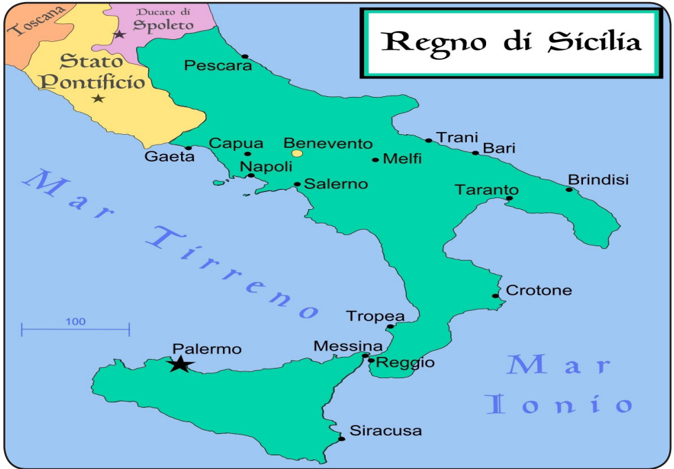
La Reĝlando de Sicilio dum la regno de Frederiko II

Sicilio havas interesan historion. En antikveco, ĝi havis grekajn koloniojn, poste fariĝis roma provinco, sekve parto de la Bizanca Imperio, poste islama emirlando. La ĉirkaŭ-200-jara islama periodo venis al fino pro invado de normandoj ekde 1060, kelkajn jarojn antaŭ la Normanda Konkero de Anglio. Roĝero II, la filo de Roĝero I (kiu estris la invadon), estis brila reĝo kun kosmopolita, intelekta kortego. Fakte multaj islamanoj restis en Sicilio. Okazis kunfandiĝo de kulturoj – greka, araba, normanda, latina-itala, kaj ankaŭ juda. Sub Roĝero II prosperis scienco, filozofio, poezio, arto, arkitekturo, kaj la insulo mem. Palermo fariĝis unu el