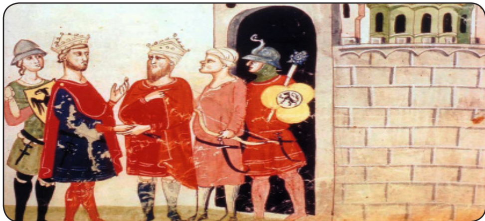
Frederiko II renkontiĝas kun Sultano Al-Kamil en Jerusalemo (G. Villani, 14a jc)

M ezepoka Eŭropo – profunde mreligia, regata de dogmeĉa, severa, netolerema katolikismo, kun persekutado de diversaj alikredantoj, krucmilitanta kontraŭ islamanoj, paganoj kaj herezaj kristanoj. Tio estas la imago, kiun ni havas de tiu epoko, kaj verŝajne plejparte ĝi estas prava. Tamen, unu el la plej grandiozaj eŭropaj imperiestroj de la Mezepoko, naskita katolika, montris grandan toleremon kaj interesiĝon rilate al aliaj religioj kaj iliaj anoj, havis scienca aliron al la mondo, subtenis sekularismon kaj batalis kontraŭ teokratio, transformis krucmiliton en pacan entreprenon, kaj sekve havis grandan konflikton kun papoj, kiuj ekskomunikis lin trifoje kaj akuzis lin pri herezo.