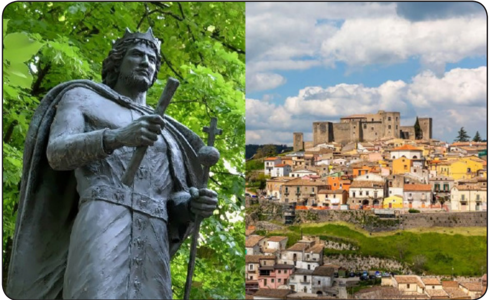
Statuo de Frederiko II en lia naskiĝurbo Jesi (Giusy Marinelli) / Melfi kun ĝia kastelo, kie la leĝaro estis proklamita (Iurii Buriak)

– tiuj lastaj anticipis leĝojn de la 20a jarcento! Nesurprize la Papo forte kritikis la Melfi-leĝaron ĉar ĝi minacis la politikan potencon de la eklezio en suda Italio.