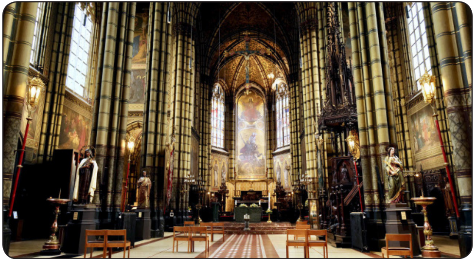
La preĝejo de Sint Joris (Sankta Georgo), Antverpeno, Belgio

Kelkajn jarojn poste mi partoprenas la skotan kongreson en Edinburgo. Dum promenado mi vizitas kun kelkaj esperantistaj geamikoj la skotan parlamenton. Tio estas ege interesa, kaj poste ni ĉiuj soifas por granda glaso da biero. Kelkaj el ni iras al la trinkejo kun iu homo, kiun mi ne konas. Enirante la trinkejon mi diras: “Ho mia dio, kiom da bruo estas ĉi tie.” La nekonato diras al mi: “Ne uzu la nomon de la Sinjoro en via parolo.” Li diras tion laŭ tre fanatika maniero, sed mi nur respondas: “Kial ne?” La nekonato komencas klarigi, sed