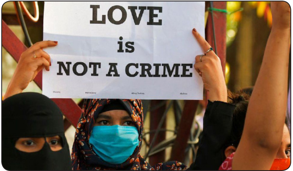
"Amo ne estas krimo" – virinoj protestas en Barato

N ovaj kontraŭkonvertaj leĝoj, kiuj krimigas interreligian amon, maltrankviligas hinduajn-islamajn parojn. Nun ili alfrontas la koleron ne nur de siaj familioj, sed ankaŭ de la registaroj de barataj ŝtatoj.