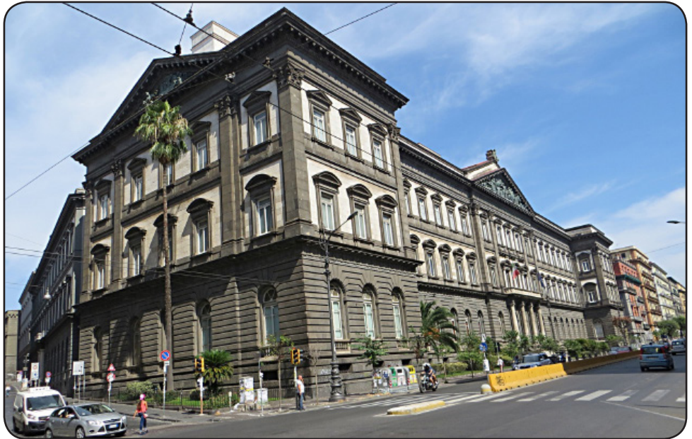
La ĉefa konstruaĵo de la Universitato de Napolo Frederiko II

La imperiestro estis viro kun grandaj scivolemo kaj intelekta energio, kaj forta deziro antaŭenigi sciojn pri la mondo kaj la universo kaj ankaŭ arton kaj literaturon; ĝuste tial li arigis ĉirkaŭ si tiun ĉiklerularon. Li kaj liaj korteganoj korespondis kun aliaj kleruloj tra Italio kaj la islama mondo, kies religio,