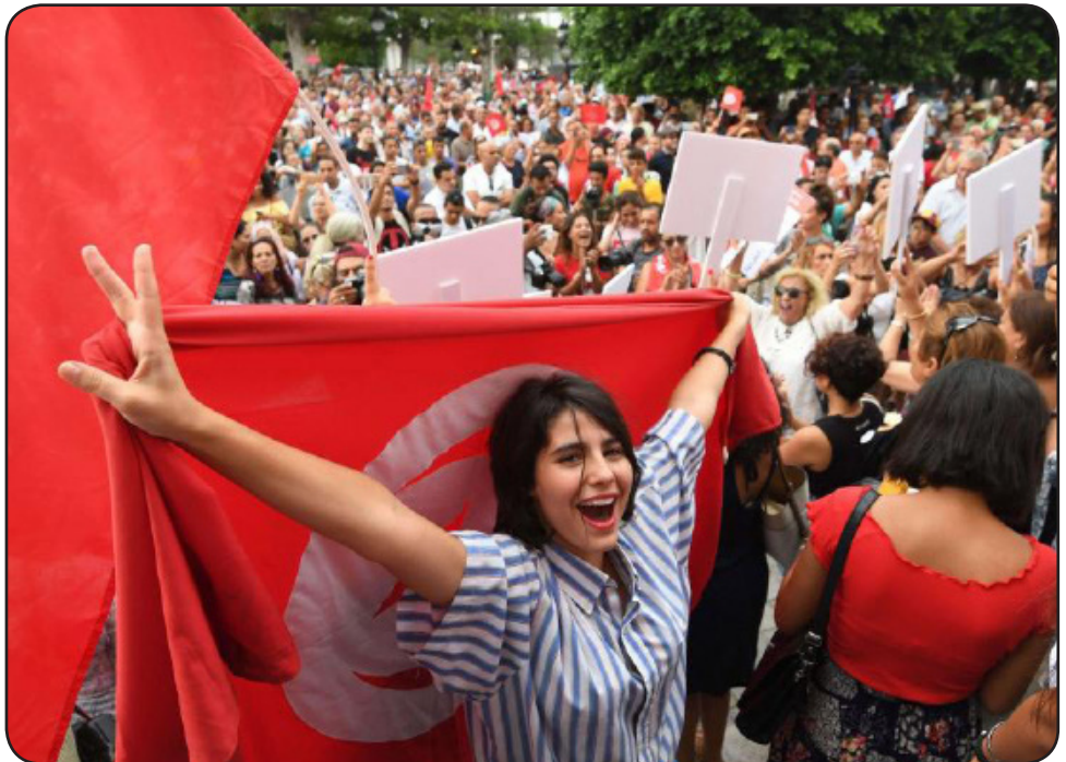
Juna tuniziano ĉe manifestacio por genra egalrajteco

Artikolo aperinta en februaro 2021 en la blogo “Neniam Milito Inter Ni” kaj modifita de la redakcio de Ateismo, kiu dankas al Anthony Bodineau pro lia atentigo pri tiu ĉi teksto.