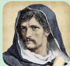
Giordano Bruno (1548-1600), filozofo, bruligita kiel herezulo

"La vero ne ŝanĝiĝas, nur ĉar ĝin kredas, aŭ ne kredas, la plejmulto da homoj."