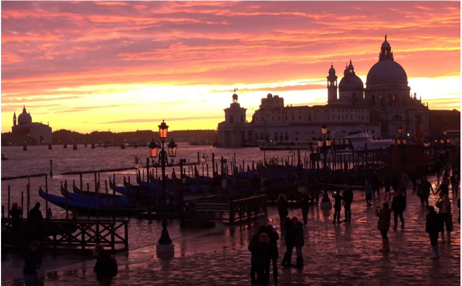
Sunsubiro en Venecio post la tria novembra inundego

ke Dio aŭ alia sankta estaĵo intervenis grace por haltigi la amasmortigan fenomenon kaj tiel savis ilin – la postvivado estis same laŭŝanca. Ja estas homa naturo senti grandan bonŝancon en tia