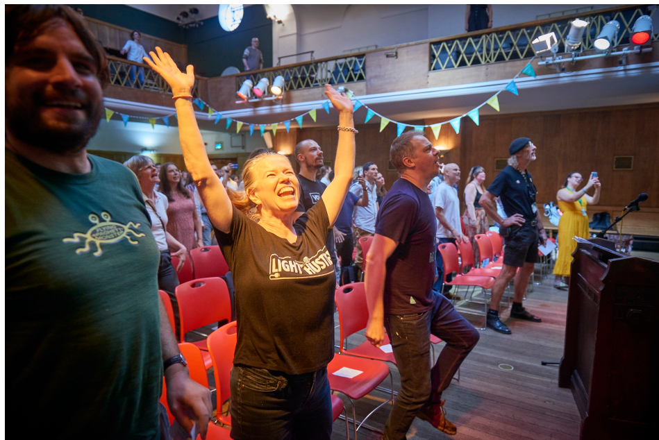
Entuziasmaj partoprenantoj en Dimanĉa Asembleo, Londono

de la vivo. Mia recenzo pri la libro de Alain de Botton aperis en la 24a numero de nia revuo de majo 2017, p. 21-22.