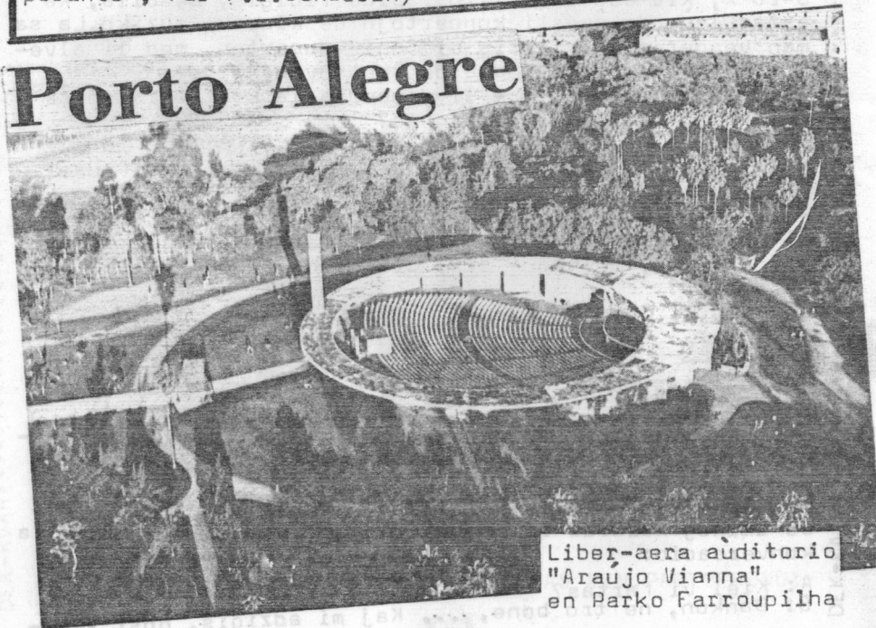
Liber-aera aŭditorio "Araujo Vianna" en Parko Farroupilha